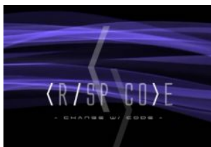
株式会社 Crisp Code https://crispcode.co.jp